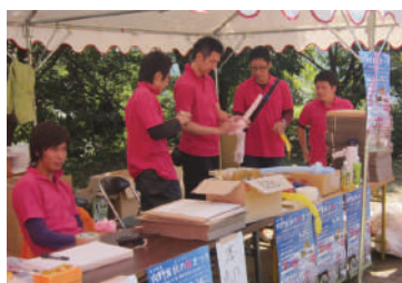
2011年 内野宿秋のさくらまつり