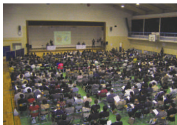
2010年 ローカルマニフェスト大会