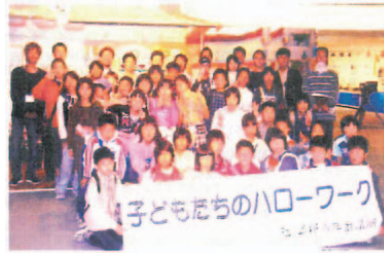
2004年 子供たちのハローワーク