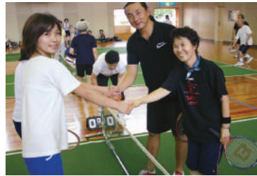
2007年 バウンドテニス事業