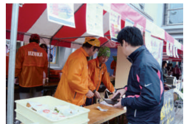
2010年 飯づ嘉もんバーガー事業