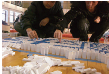
2009年 ドミノでつくろう友達の和1