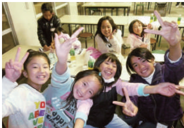
2009年 ドミノでつくろう友達の和2