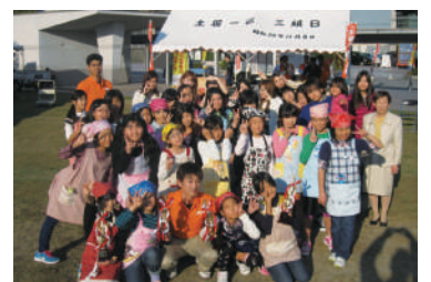
2012年 子供アイデア料理コンテスト