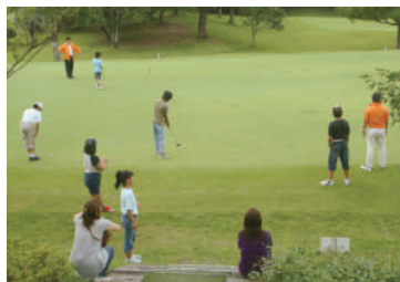
2009年 ゴルフ～ジュニア選手権を飯塚の地で