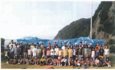
2006年 大島サマーキャンプ