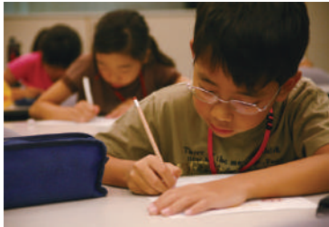
2008年 わくわくスクール